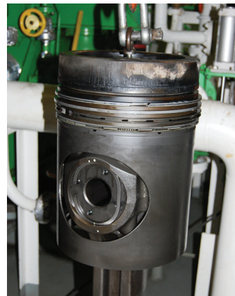
Ein Kolben des sog. „Hilfsdiesels“

Der positive Nebeneffekt, den es quasi „gratis“ obendrein gibt: Durch die erzeugte Oberflächenveredelung im Verbrennungsmotor läuft die Maschine nicht nur reibungs- und vibrationsärmer, sondern es sinken auch die Temperaturen des Umlauföls, was sich positiv auf die Lebensdauer des Motors und die Standzeit des Schmierstoffs auswirkt.